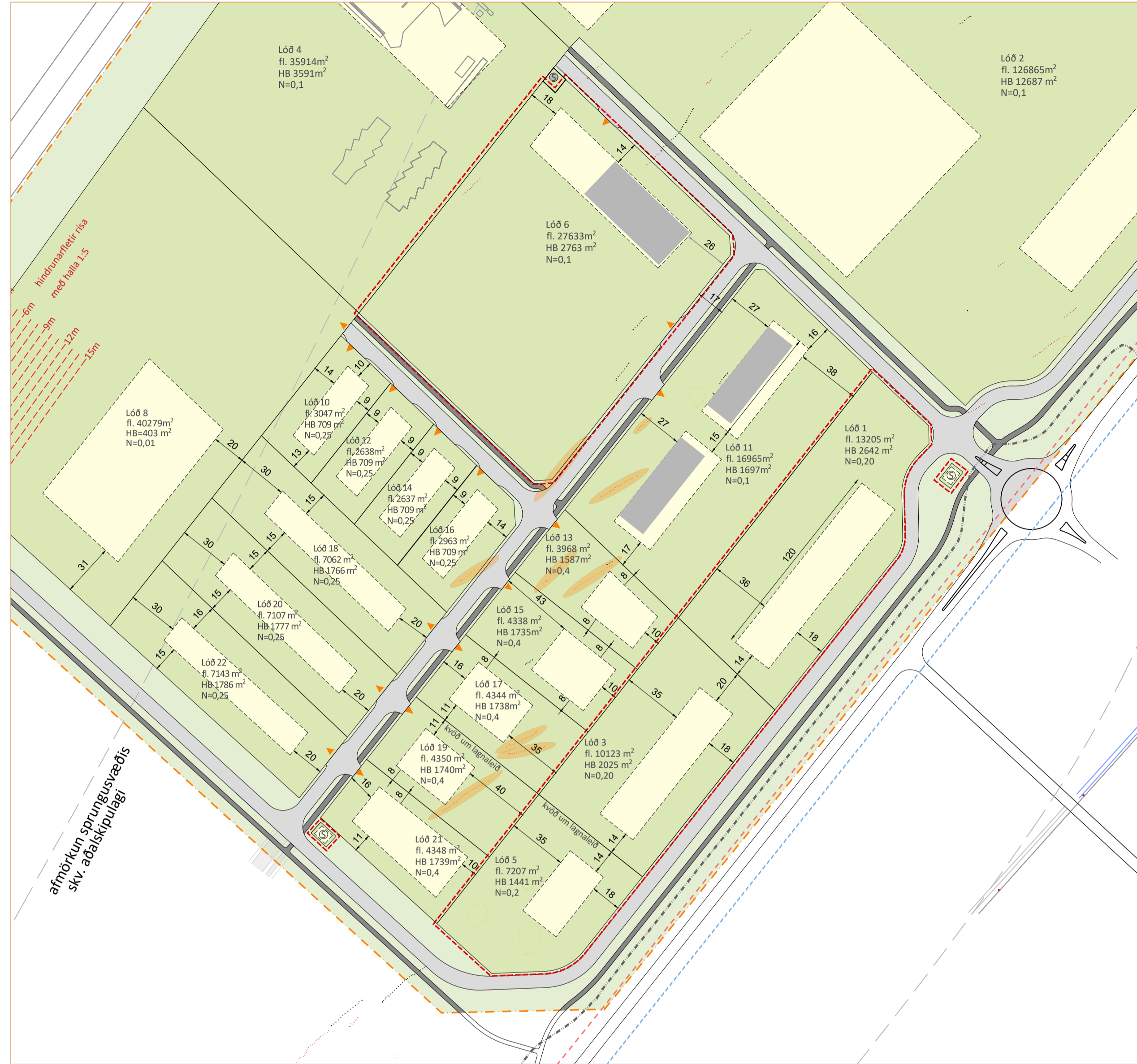
BREYTING Á DEILISKIPULAGI 1:2500