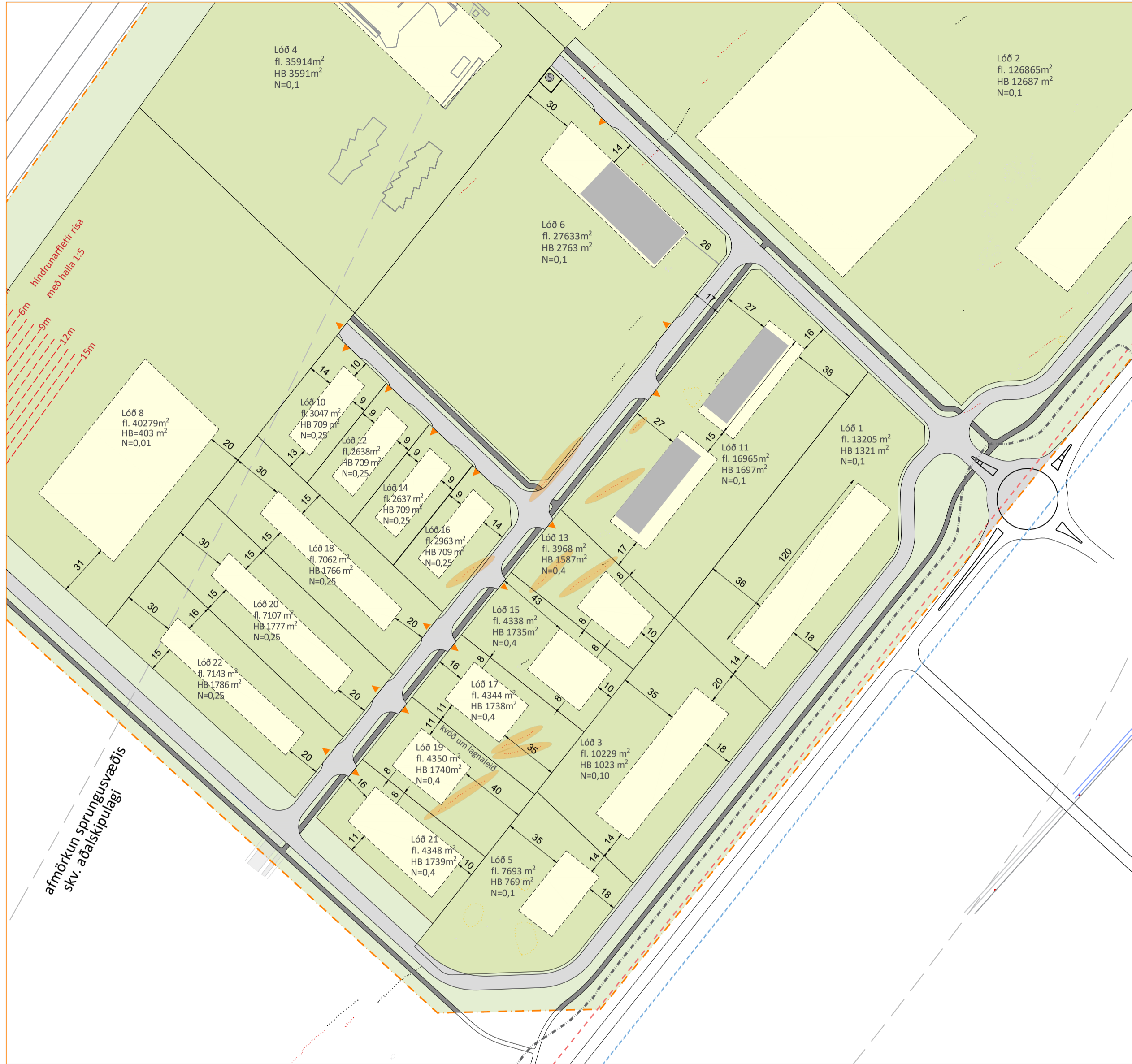
HLUTI AF NÜGILDANDI DEILISKIPULAGI SAMÞYKKT Í BÆJARSTJÓRN ÁRBOGAR 22.12.2018, BREYTT SEP 2014, MAÍ 2017 OG APRÍL 2021